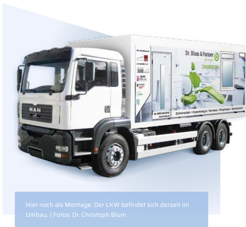
Hier noch als Montage: Der LKW befindet sich derzeit im Umbau.

Freie Fahrt hat Blum zudem vom Gesundheitsamt bekommen; die Hygieneanforderungen werden demnach erfüllt. Das Umwelt- und Energieministerium, die Struktur- und Genehmigungsbehörde Nord sowie der TÜV haben der mobilen Röntgenanlage grünes Licht gegeben.